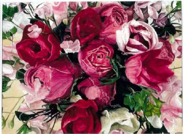
バラ・アネモネ・スイトピー・デルフィニュームの饗宴