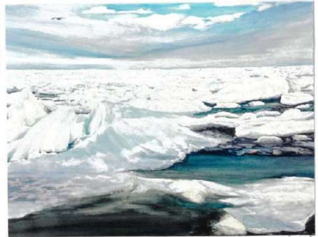
2025 白日会展 北のオホーツク流氷が哭いて