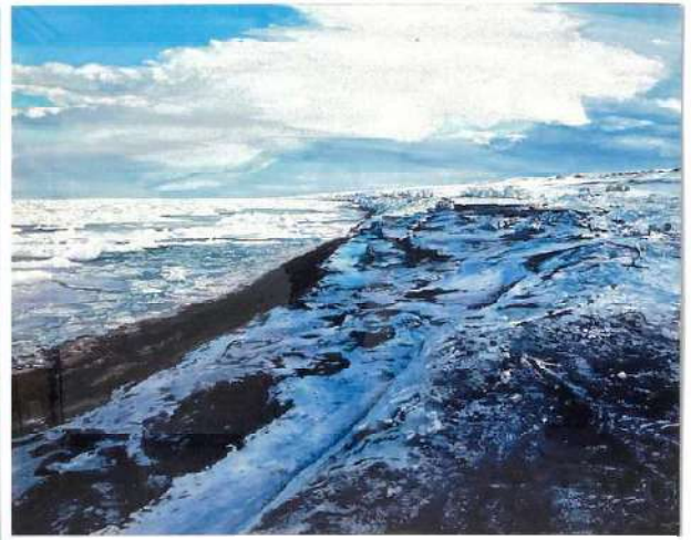
2025 日展 流氷が接岸して