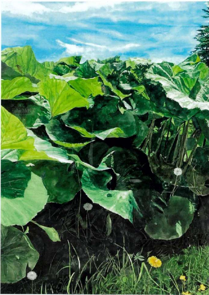
2025 日本水彩展 群生～薫風が吹きわたって