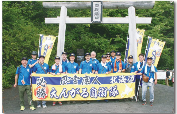
8月5日 関東がんぼう同志会との懇談会(東京都)