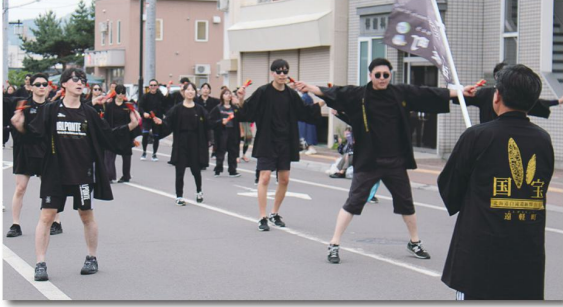
7月13日 遠軽がんぼう夏まつり