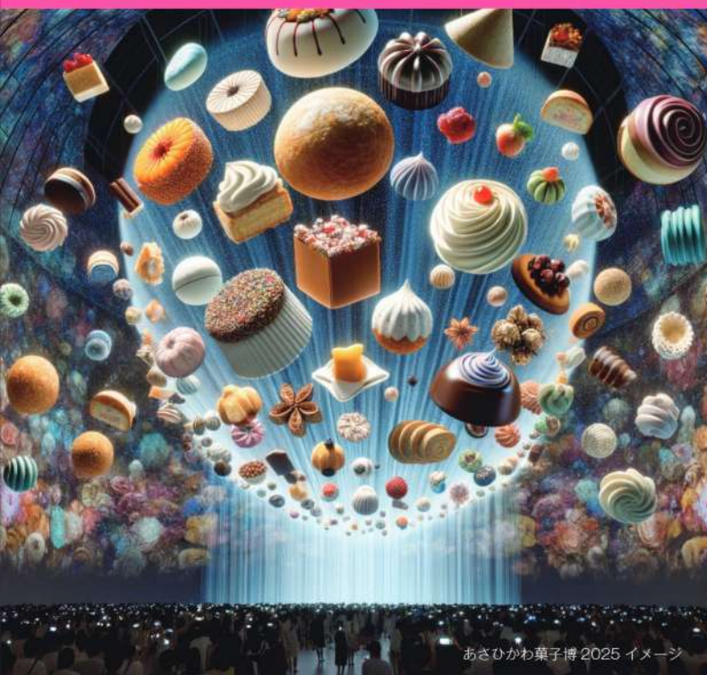
あさひかわ菓子博 2025 イメージ