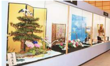
2017年の三重「お伊勢さん博覧会」の様子

全国の菓匠(菓子職人)達が伝統の技を駆使して制作した、大型工芸菓子を一堂に集めて展示。