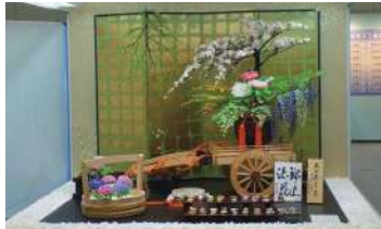
2017年の三重「お伊勢さん博覧会」の様子