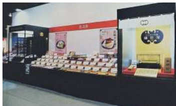
2017年の三重「お伊勢さん博覧会」の様子