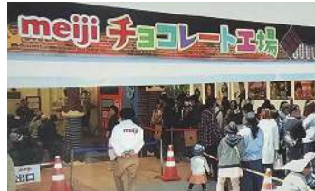
2017年の三重「お伊勢さん博覧会」の様子

ゲームや珍しいお菓子のサンプリングなど、大人も子どもも楽しめる参加・体験型メーカーブースです。