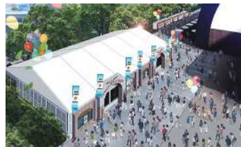
あさひかわ菓子博 2025 イメージ