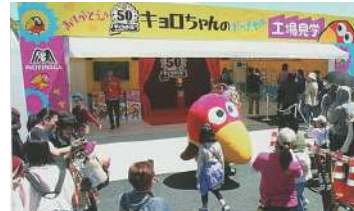
2017年の三重「お伊勢さん博覧会」の様子