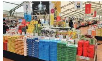
2017年の三重「お伊勢さん博覧会」の様子

折り鶴募集! ～ 平和への願いをお菓子にのせて～ ※詳しくはホームページをご覧ください。 「折り鶴プロジェクト」へのご参加をお願いします。／ 2025年2月28日まで