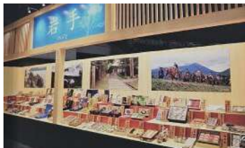
2017年の三重「お伊勢さん博覧会」の様子