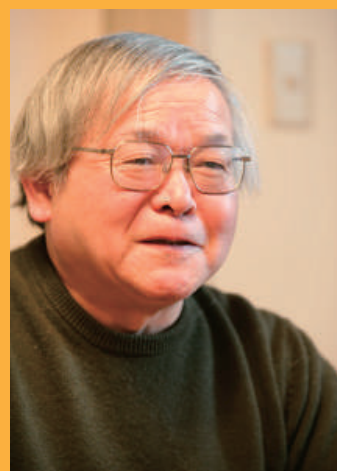
漫画家 安彦 良和 氏 (遠軽町出身)